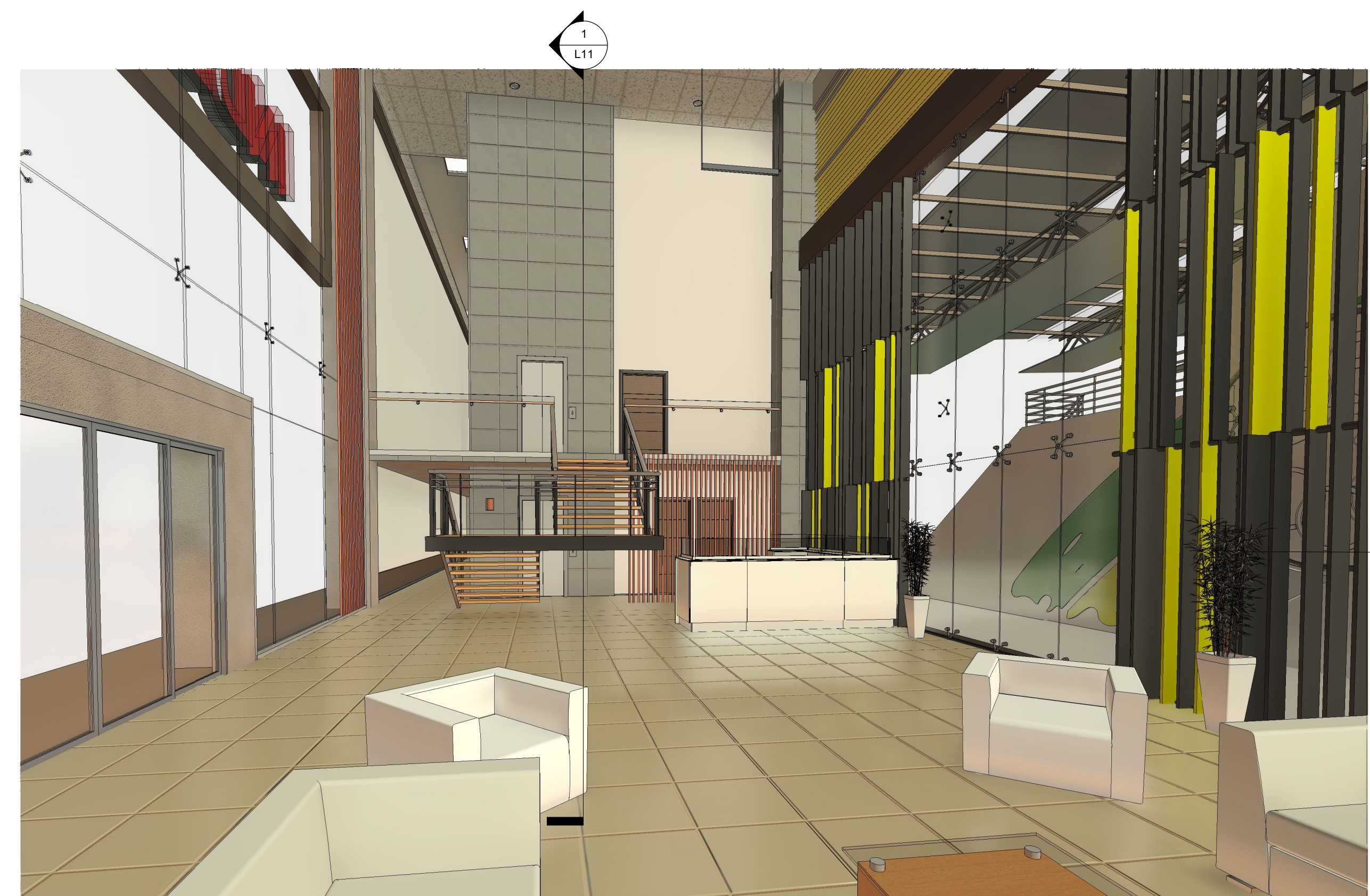
3 Vista 3D RECEPCION