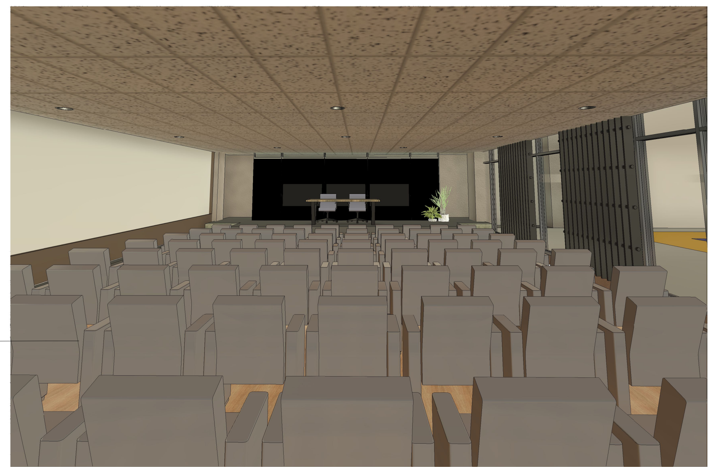
4 Vista 3D AUDITORIO